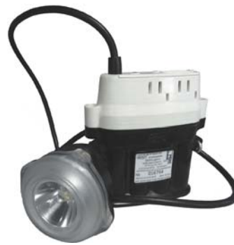
Рис. 2 Устройство оповещения (индивидуальное устройство шахтера)

Устройство оповещения с полным комплектом функций головного светильника, а также со встроенным газоанализа-