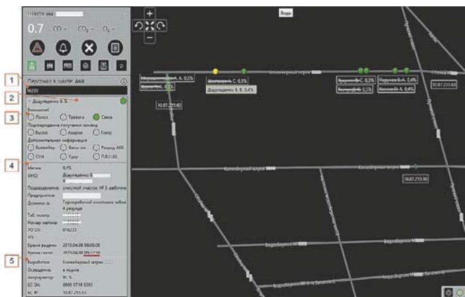
Рис. 3 Отображение данных телеметрии с устройства оповещения:

Данные сканирующего контроля в системе «SBGPS» могут быть отображены в виде графиков с историческими данными (рис. 4). На графике показано изменение concentra-