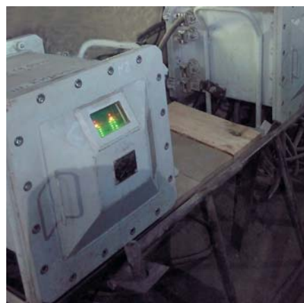
Рис. 1 Контроллер питания базовых станций системы «SBGPS»

– цифровые технологии предпочтительнее аналоговых, поскольку позволяют передавать существенно большее количество информации с более высо-