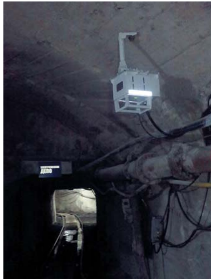
Рис. 2 Базовая станция системы «SBGPS»

Отличительной особенностью рассматриваемой системы является наличие в подземной инфраструктуре высокоскоростного канала связи – мощного «путепровода» информационных потоков. «Путепровод», помимо исполнения основных функций безопасности, способен передать на верхний уровень, то есть на пульт горного диспетчера, разноплановую информацию других систем из состава МФСБ и АСУТП. В частности, на ряде шахт в системе «SBGPS» уже реализован полноценный сканирующий (динамический) газовый анализ, то есть контроль и передача в режиме реального времени данных измерений метана на пульт диспетчера с газоанализатора, встроенного в головной светильник. Также получает развитие технология телеметрии рабочих параметров самоходного подземного транспорта в движении с передачей на-гора данных о местоположении в непрерывном режиме.