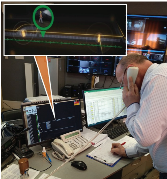
Рис. 1 Схема шахты на АРМ диспетчера с указанием местоположения людей в горных выработках

На рис. 2 показан вариант отображения такого сигнала на мониторе АРМ диспетчера. Понятно, что после получения запроса о помощи диспетчер должен решить задачу по оказанию помощи, отправив, например, необходимую команду другому человеку, находящемуся поблизости от отправившего тревожный сигнал.